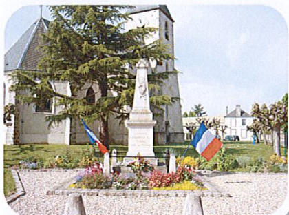
8 mai 2020

Cette année la fête Nationale n'a pas pu être célébrée comme les autres années et les commémorations du 8 mai et du 11 novembre se sont faites en petit comité .