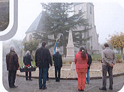
11 novembre 2020